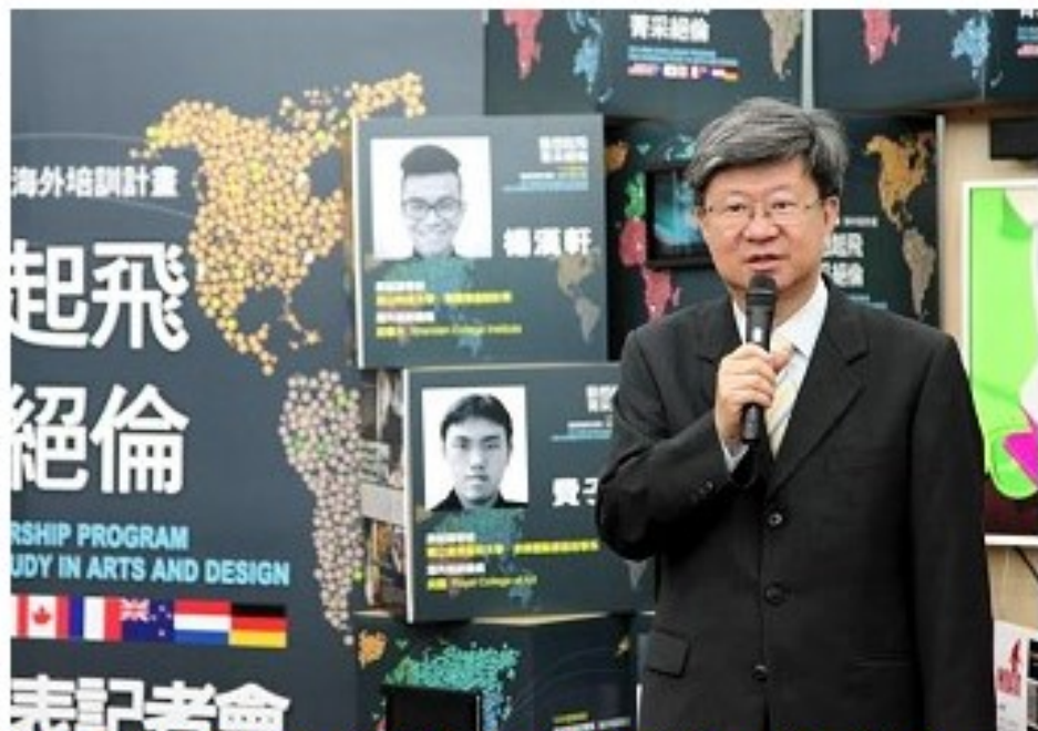
教育部長吳思華說明藝術與設計菁英海外培訓計畫成果。

在簽證，今年法國更排除萬難發出「實習簽證」，讓除了工作、留學簽證外，更多了一個管道可以前往海外，體驗並提升能力。