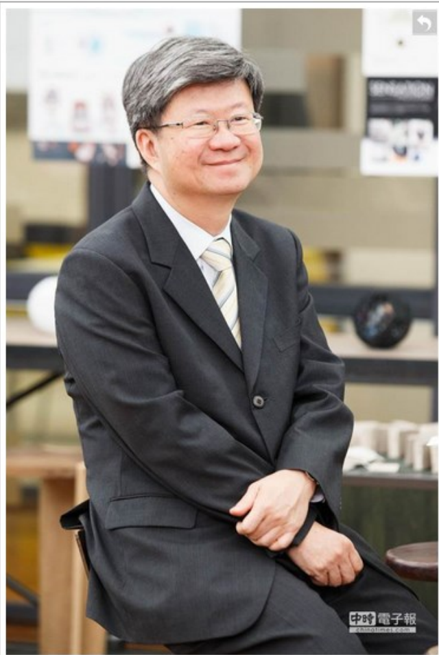
教育部長吳思華在致詞時表示，一流的人材才能創造一流的文化，希望這些歸國同學能把國外經驗帶回國內。