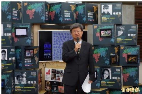
教育部長吳思華認為，台灣學生創造力無限，到海外實習有助體驗深層、多元文化，並實踐社會關懷，將創意落實。

台灣需走向文創產業，到國外實習或進修往往卡在簽證，今年法國更排除萬難發出「實習簽證」，讓除了工作、留學簽證外，更多了一個管道可以前往海外，體驗並提升能力，通過徵選後教育部個每人核發全額獎學金，150萬到200萬元，補助機票及生活費等，讓學子無後顧之憂。